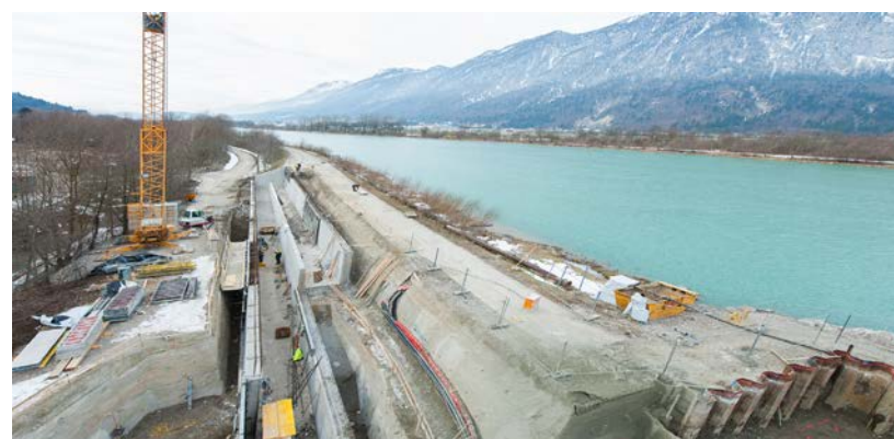
Die Fischwanderhilfe Hirnbach stellt am Kraftwerk Langkampfen die Fisch-Durchgängigkeit wieder her. Bis Herbst 2015 wird die volle Funktionstüchtigkeit erreicht.