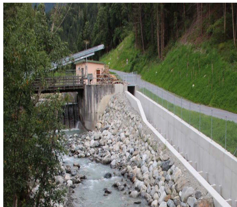
Fischtreppe an der Pitze: Kleine Wasserbecken ermöglichen Fischen, den Höhenunterschied zwischen Ober- und Unterwasser zu überwinden.

Alle ökologischen Maßnahmen und die Fischwanderhilfen an TIWAG-Kraftwerksanlagen finden Sie im Detail unter http://wasserkraftausbau.tiwag.at/oekologie/