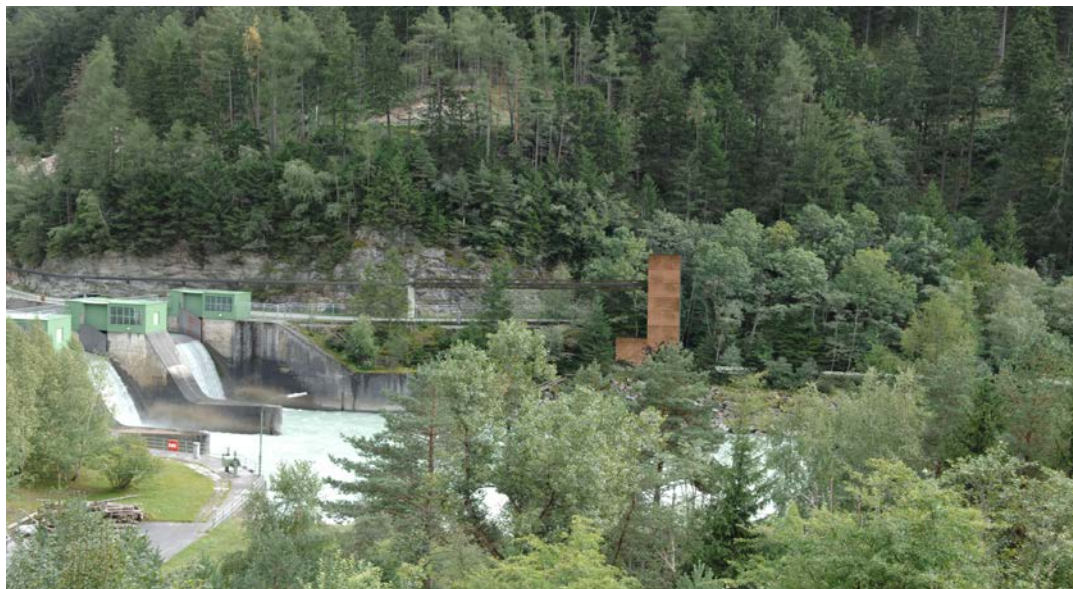
Der erste Fischlift Österreichs entsteht seit Herbst 2014 in der Runserau. Der Lebensraum für Bachforelle und Äsche wird dadurch deutlich verbessert.

Die TIWAG arbeitet laufend an der ökologischen Adaptierung ihrer Kraftwerksanlagen. Schließlich sind Fließgewässer gemäß EU-Wasserrahmen-Richtlinie (EU-WRRL) bis spätestens 2027 in einen guten ökologischen Zustand bzw. in ein gutes ökologisches Potenzial zu versetzen. Hierzu gehört auch die Schaffung von Fischwanderhilfen an Querbauwerken.